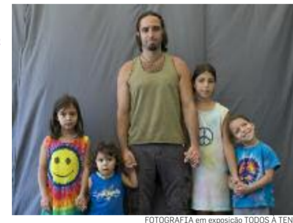
FOTOGRAFIA em exposição TODOS A TENDA